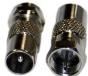
FB 06 F - Stecker auf IEC - Stecker