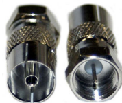
FB 04 F - Stecker auf IEC - Buchse