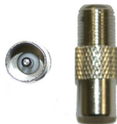
FB 02 F - Buchse auf IEC - Stecker