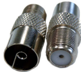
FB 01 F - Buchse auf IEC - Buchse