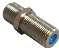
FB 03 F - Buchse auf F - Buchse lange Ausführung, für Verteiler-/ Erdungsschienen geeignet, hohe Rückflussdämpfung , (5-65 MHz > 50 dB, 65-865 MHz > 40 dB, 950 - 2500 MHz > 30 dB)